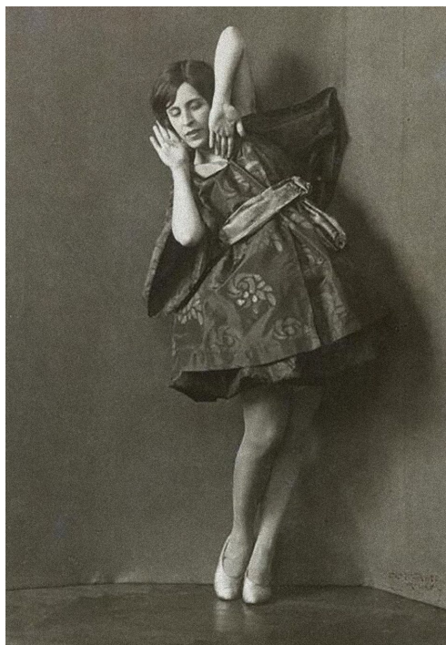
Gertrud Bodenwieser, 1890–1959

Das Gedenkbuch für die Opfer des Nationalsozialismus an der Musik und Kunst Privatuniversität (MUK) der Stadt Wien verzeichnet jene Lehrende, die in den Jahren 1938–1945 Opfer nationalsozialistischer Verfolgung wurden.