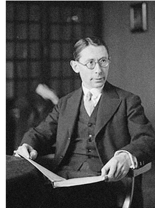
Dr. Hans (Johann) Gál, 1890–1987