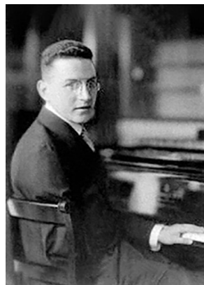
Paul Wittgenstein, 1887–1961

Der Entschluss, 1938 in Wien eine Musikschule zu gründen, an der die NS-Organisationen Hitlerjugend (HJ) und Kraft-durch-Freude (KdF) andocken sollten, war Teil einer groß angelegten Strategie der nationalsozialistischen Stadtverwaltung, die Wien als Kulturstadt des Reiches „wiederaufzubauen“ trachtete.